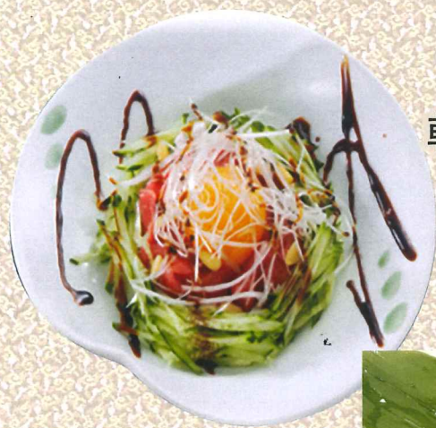
韩式酱鲷鱼配生鸡蛋 1,190円