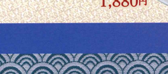
本地金目鲷刺身 1,880円