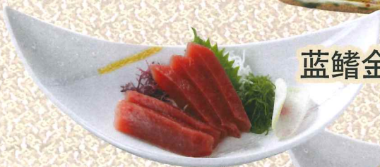
蓝鳍金枪鱼赤身刺身 1,350円