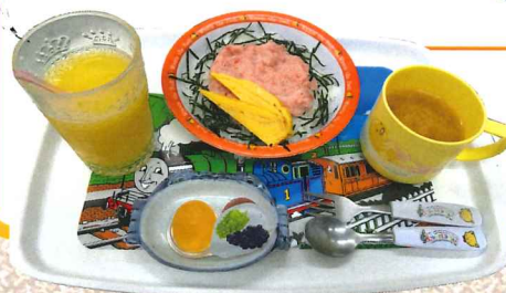
金枪鱼饭丼套餐 1,380円