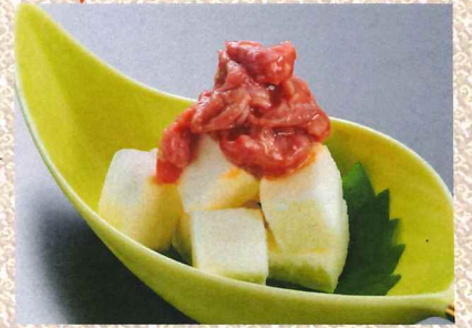
奶油芝士浇金枪鱼酒盗 460円