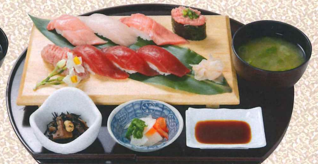
蓝鳍金枪鱼多样寿司定食 2,600円