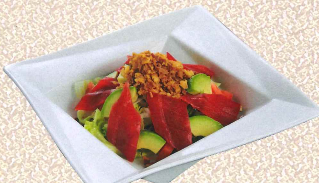
蓝鳍金枪鱼牛油果沙拉 1,360円