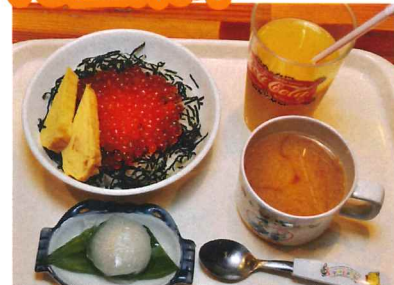
儿童鲑鱼籽丼套餐 迷你鱼籽丼、 味噌汤、甜品、果汁 1,380円