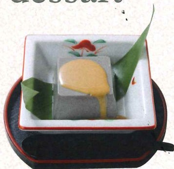
葛粉芝麻布丁 浇芝麻酱 320円