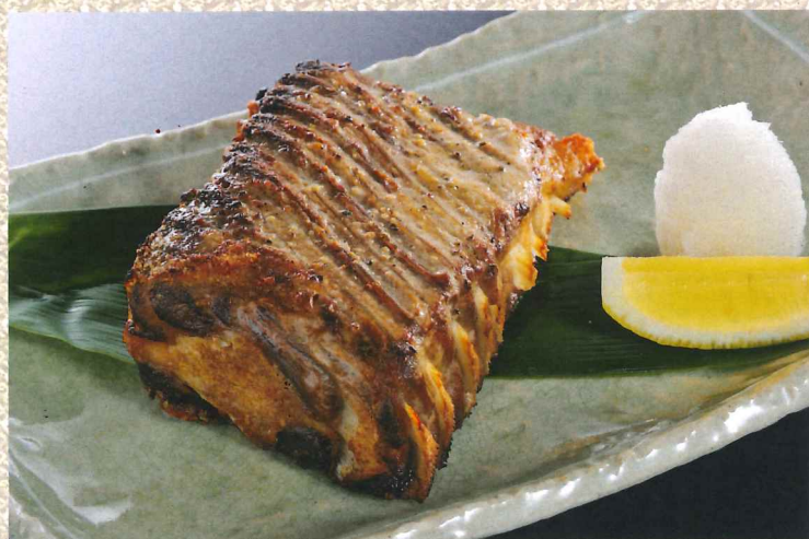
盐烤金枪鱼背鳍 1,480円