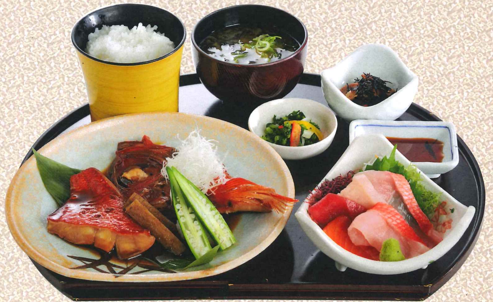
本地金目鲷定食附刺身 3,700円