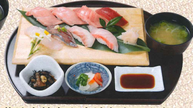
蓝鳍金枪鱼和本地鱼寿司定食 (大島) 蓝鳍金枪鱼大腩入 2,900円