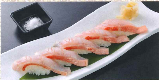
本地金目鲷火烤寿司 (5只) 1,880円