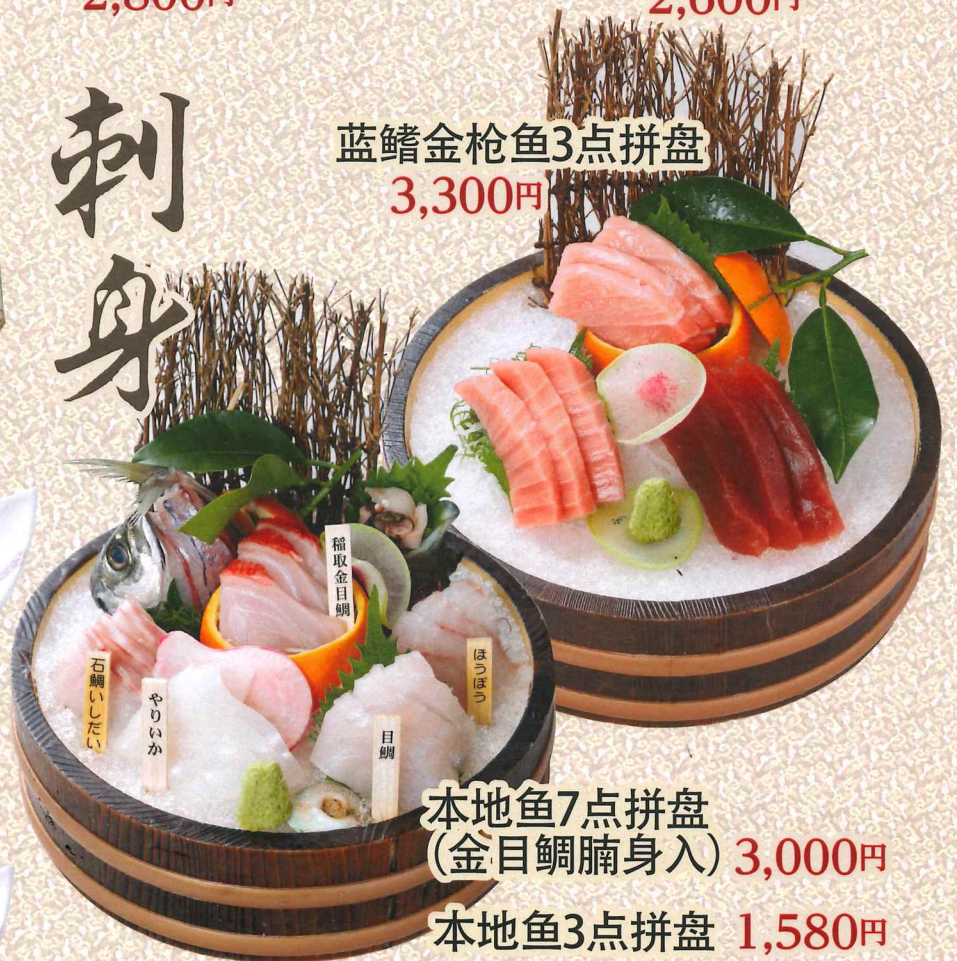
本地鱼7点拼盘 (金目鲷腩身入) 3,000円