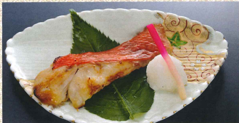
本地金目鯛櫻叶西京烧 1,680円