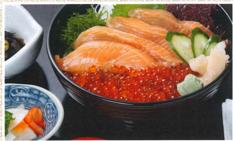
鲑鱼及鲑鱼籽丼 2,800円