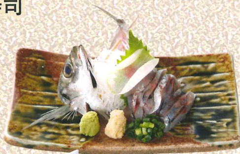
本地鲷鱼刺身、肉丁 880円