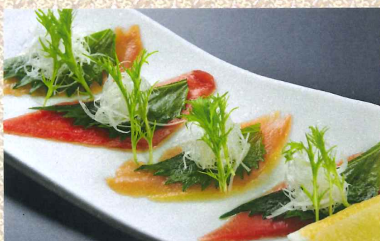
蓝鳍金枪鱼片浇橄榄油 980円