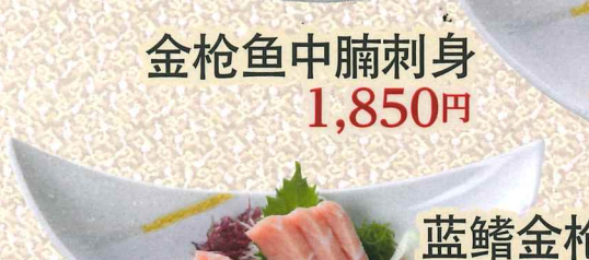
金枪鱼中腩刺身 1,850円