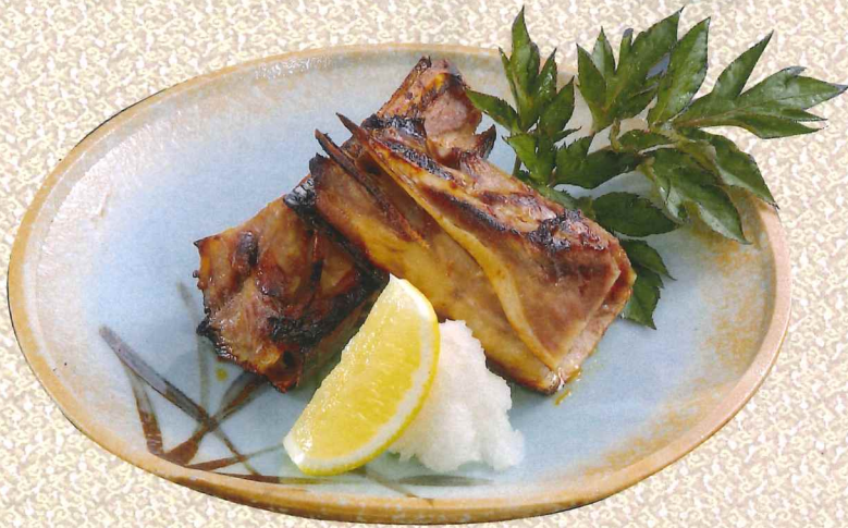
火烤金枪鱼肋骨 980円