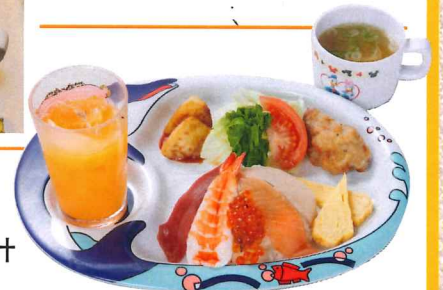
儿童午餐 980円 迷你海鲜丼、炸鸡块、味噌汤、果汁