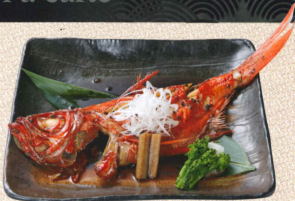
本地金目鯛炖煮(半身) 【大】3,200円 【中】2,980円