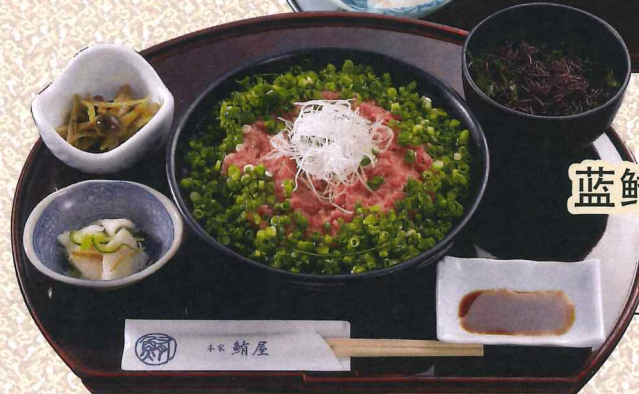
蓝鳍金枪鱼肉丁丼 1,980円