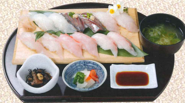
本地鱼寿司12只定食 2,800円