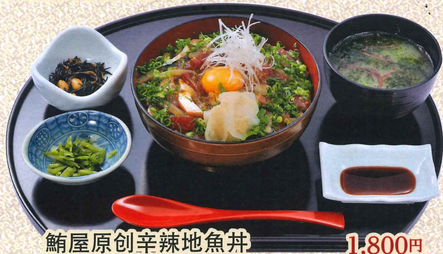
鮪屋原创辛辣地魚丼 1,800円