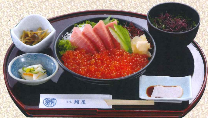
蓝鳍金枪鱼中腩鲑鱼籽丼 3,570円