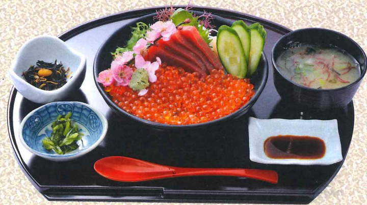
蓝鳍金枪鱼赤身鲑鱼籽丼 2,800円