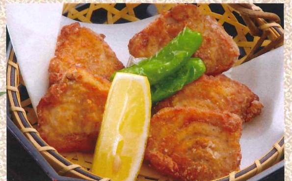
油炸金枪鱼白子 980円