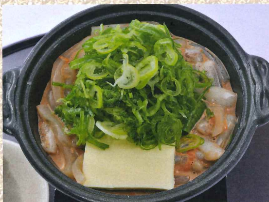
鱿鱼肝身陶板烧 1,280円