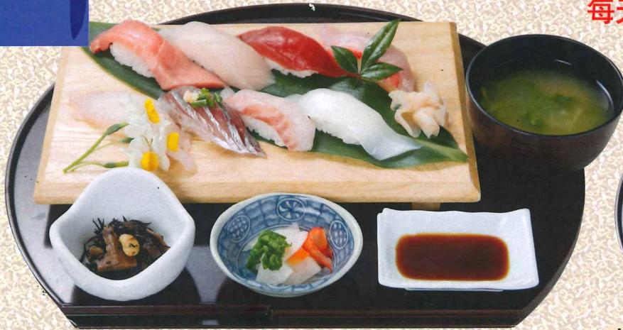
蓝鳍金枪鱼和本地鱼寿司定食 (初島) 2,380円