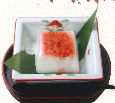
葛粉布丁浇杨梅酱 320円