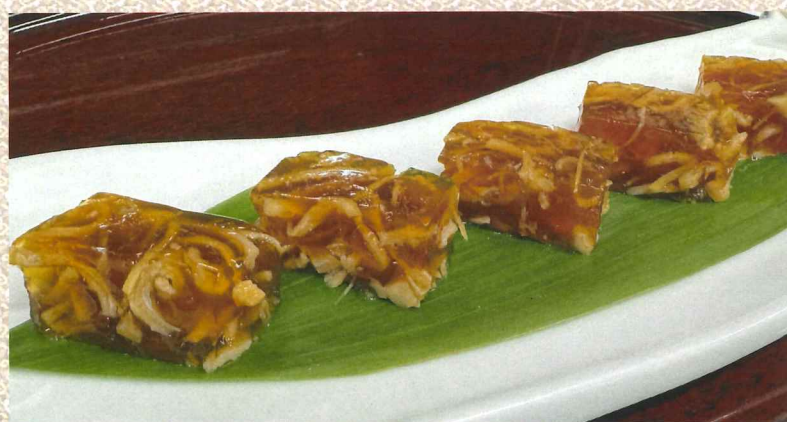
由凝固金枪鱼高汤制成的菜肴 660円