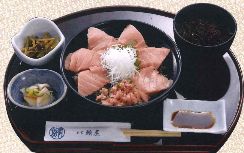
蓝鳍金枪鱼大腩丼(葱花金枪鱼腩) 3,800円