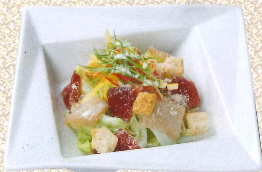
蓝鳍金枪鱼生鱼片凯撒沙拉 1,360円