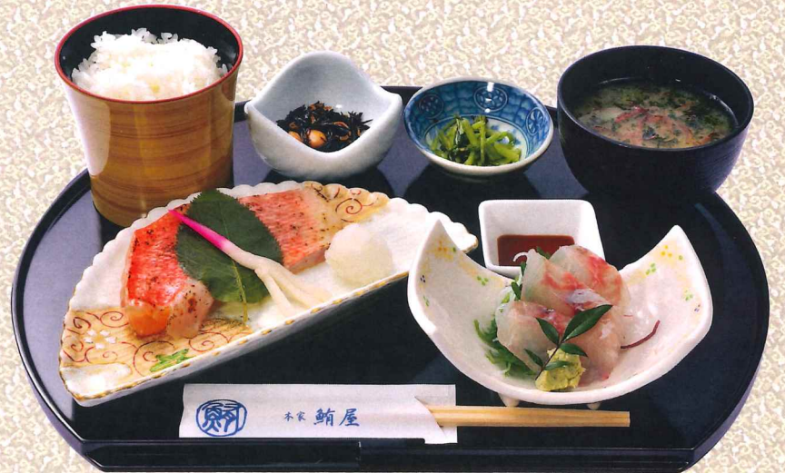
本地金目鲷樱叶西京烧定食 2,700円