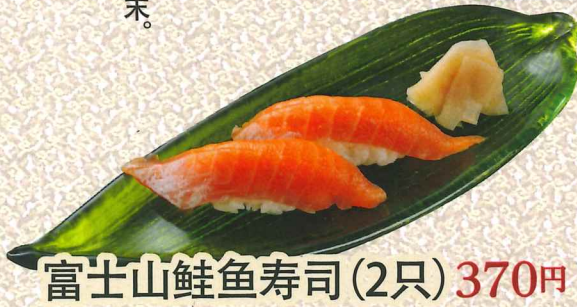
富士山鲑鱼寿司(2只) 370円