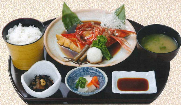
本地金目鲷定食(鱼片) 2,700円